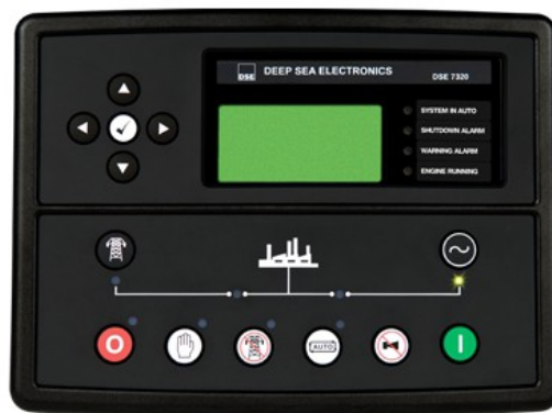
Central DSE 7320