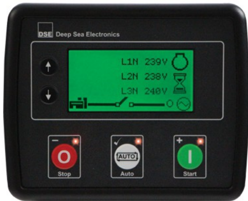
Central DSE 4510