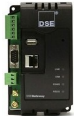
DSE webnet Gateway 890/891

Módulo que permite conectar las centrales con un dataserver DSE mediante una conexión ethernet ó GPRS e incluye funciones GPS.