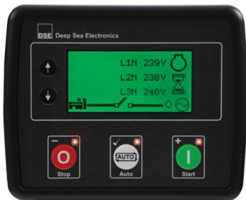
Central DSE 4510