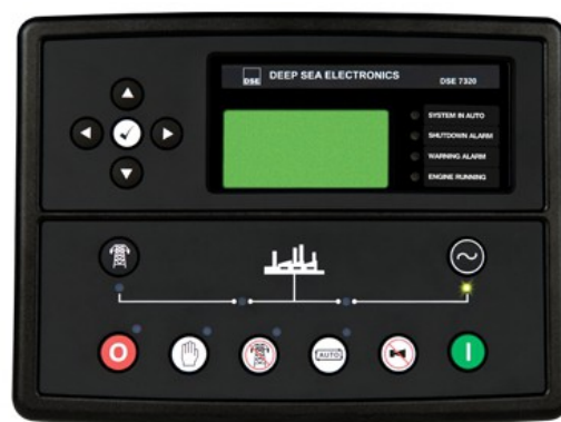
Central DSE 7320