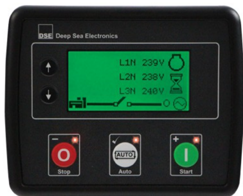
Central DSE 4510