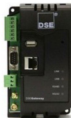
DSE webnet Gateway 890/891

Módulo que permite conectar las centrales con un dataserver DSE mediante una conexión ethernet ó GPRS e incluye funciones GPS.