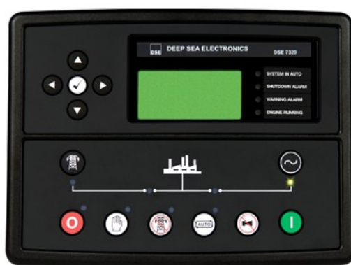
Central DSE 7320